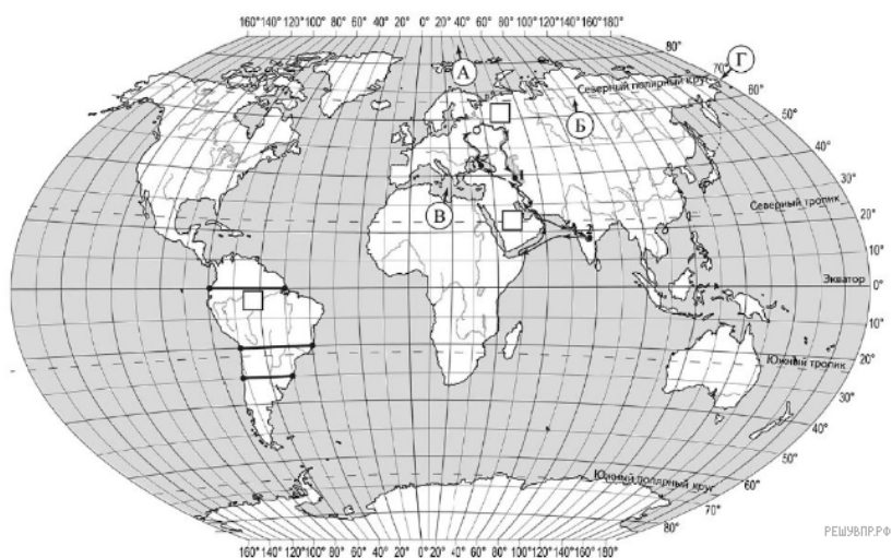
Карта составлена по состоянию на 01.01.2019

5. По какому из отрезков, проведённых на карте вдоль трёх параллелей, пересекающих материк Южная Америка, построен профиль рельефа, представленный на рисунке? Укажите в ответе значение параллели.