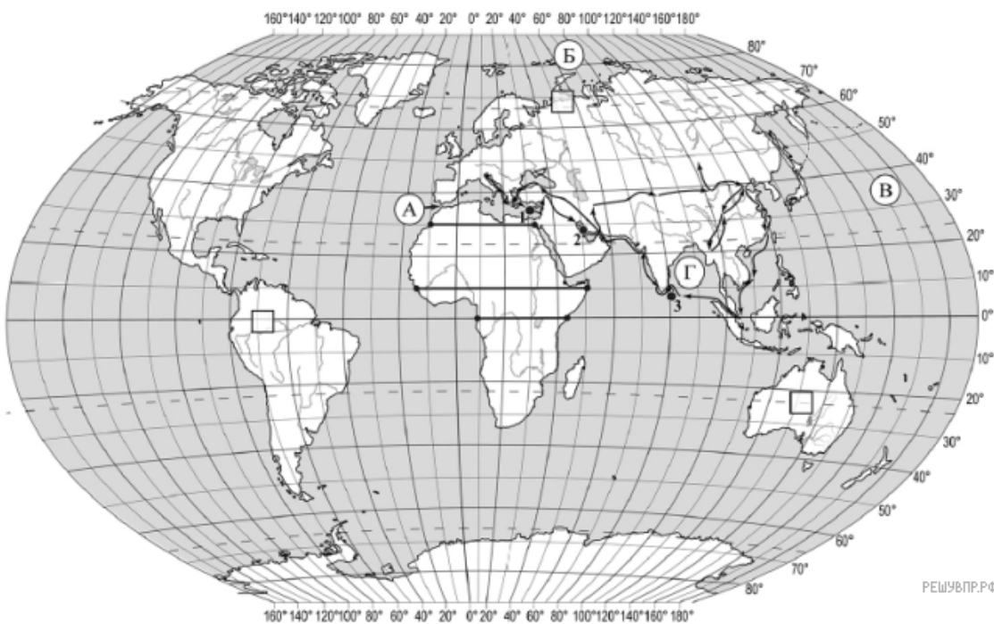
Карта составлена по состоянию на 01.01.2019

На рисунке представлены значки, которыми обозначаются месторождения полезных ископаемых на географических картах.