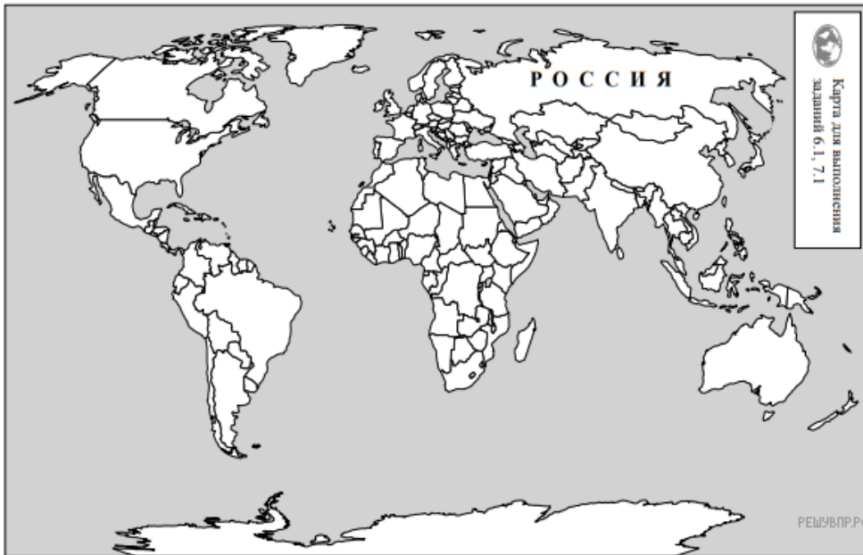
Карта составлена по состоянию на 01.01.2017

Определите, структуру занятости населения какой страны отражает каждая диаграмма. Запишите в ответе порядковые номера стран под соответствующими буквами.