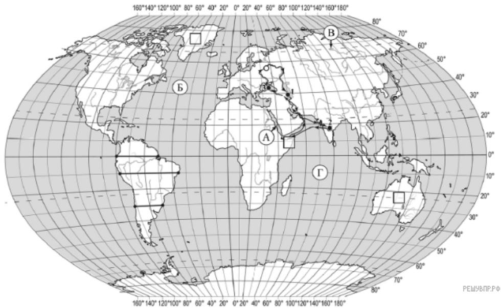
Карта составлена по состоянию на 01.01.2019

По выбранной Вами в задании 3.2 климатограмме определите климатические показатели для указанной природной зоны и заполните таблицу.