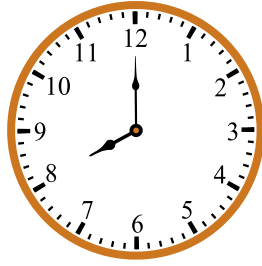
1 марта 08:00 решувпр.рф