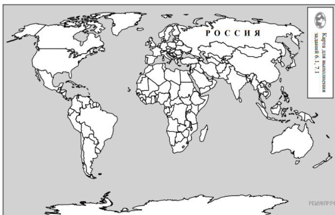
Карта составлена по состоянию на 01.01.2017

Определите, структуру занятости населения какой страны отражает каждая диаграмма. Запишите в ответе порядковые номера стран под соответствующими буквами.