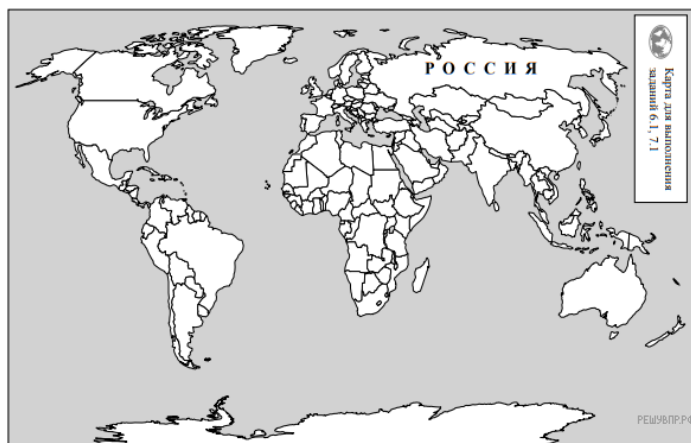
Карта составлена по состоянию на 01.01.2017

Определите, возрастной состав населения какой страны отражает каждая диаграмма. Запишите в ответе порядковые номера стран под соответствующими буквами.