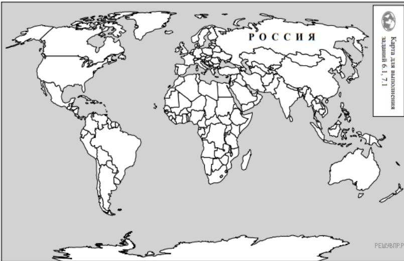
Карта составлена по состоянию на 01.01.2017

Определите, возрастной состав населения какой страны отражает каждая диаграмма. Запишите в ответе порядковые номера стран под соответствующими буквами.