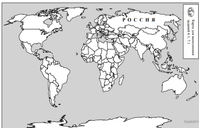
Карта составлена по состоянию на 01.01.2017

Определите, возрастной состав населения какой страны отражает каждая диаграмма. Запишите в ответе порядковые номера стран под соответствующими буквами.