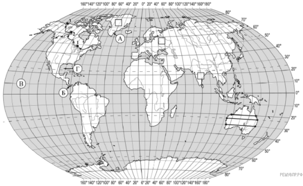
Карта составлена по состоянию на 01.01.2019

По какому из отрезков, проведённых на карте вдоль трёх параллелей, пересекающих материк Австралия, построен профиль рельефа, представленный на рисунке 1? Укажите в ответе значение параллели.