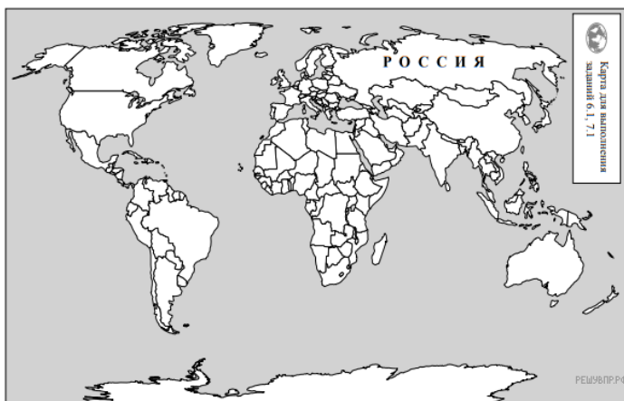
Карта составлена по состоянию на 01.01.2017

Определите, возрастной состав населения какой страны отражает каждая диаграмма. Запишите в ответе порядковые номера стран под соответствующими буквами.