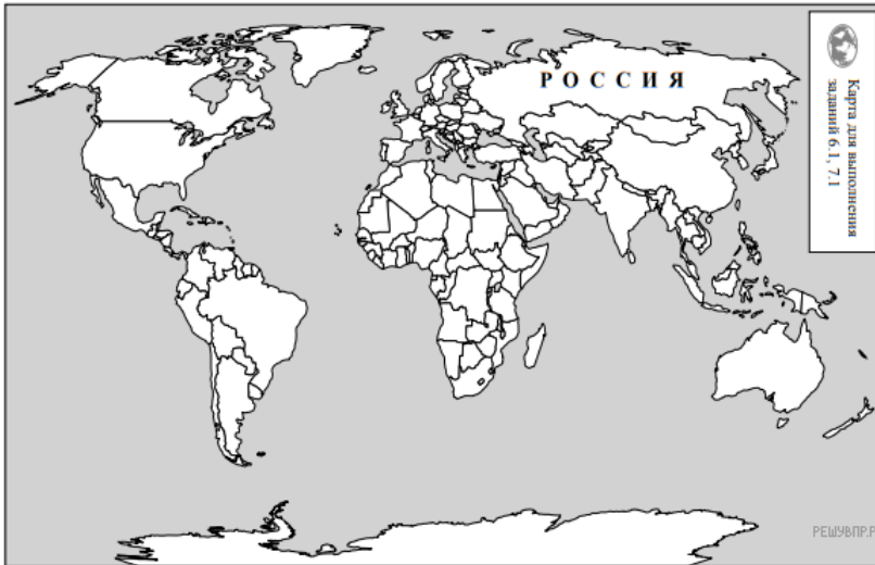
Карта составлена по состоянию на 01.01.2017

Определите, возрастной состав населения какой страны отражает каждая диаграмма. Запишите в ответе порядковые номера стран под соответствующими буквами.