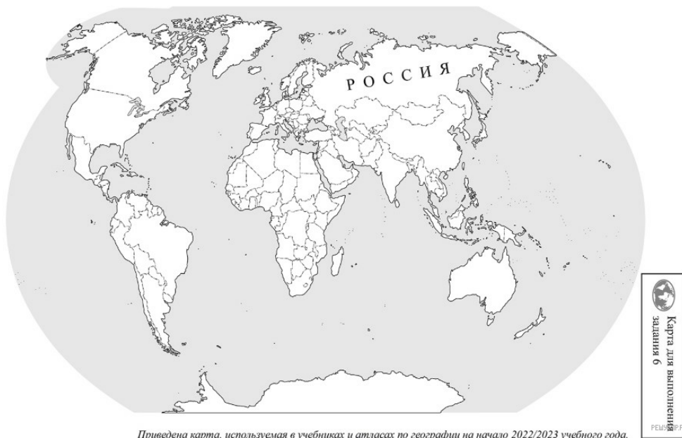
Приведена карта, используемая в учебниках и атласах по географии на начало 2022/2023 учебного года.

Карта составлена по состоянию на 01.01.2023