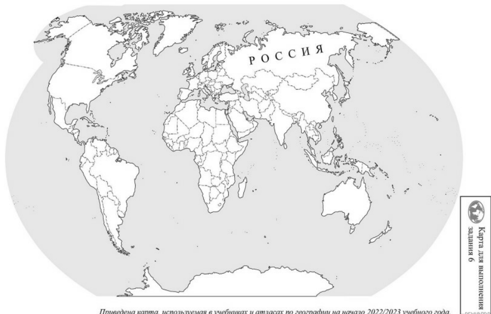
Приведена карта, используемая в учебниках и атласах по географии на начало 2022/2023 учебного года.

Майкл и Ченг познакомились на международной книжной выставке. Майкл живёт в столице США, а Ченг — в столице Китая. Подростки общаются через Интернет, и при общении им приходится учитывать разницу во времени между их городами.