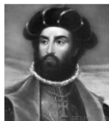
Васко да Гама

Подпишите на карте название океана, которого удалось достичь этой экспедиции.