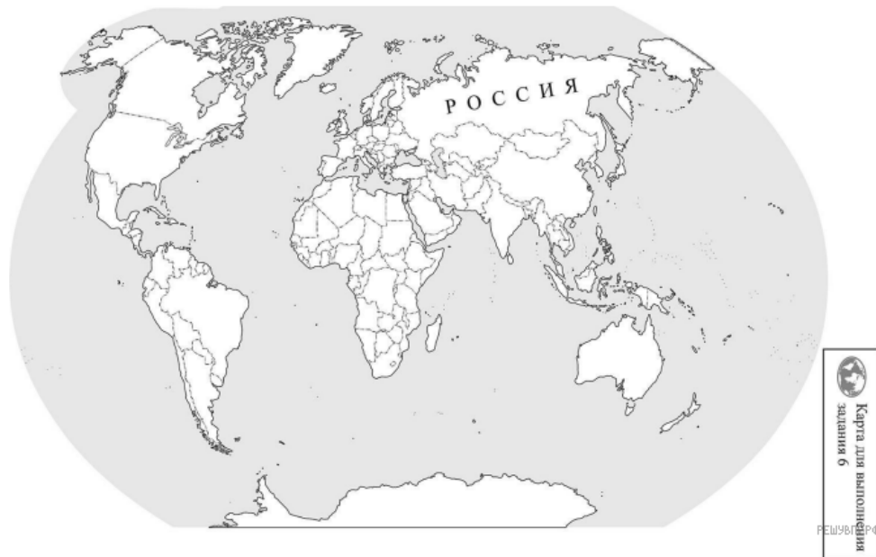
Карта составлена по состоянию на 01.01.2022