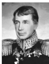
И. Ф. Крузенштерн