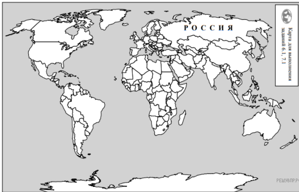
Карта составлена по состоянию на 01.01.2017

Определите, возрастной состав населения какой страны отражает каждая диаграмма. Запишите в ответе порядковые номера стран под соответствующими буквами.