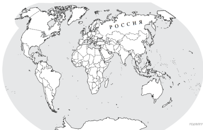
Карта составлена по состоянию на 01.01.2018

Возрастной состав населения какой страны отражает представленная на рисунке диаграмма? Запишите в ответе название страны.