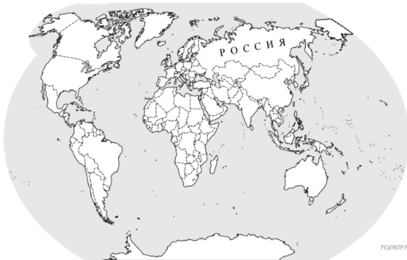
Карта составлена по состоянию на 01.01.2018

Возрастной состав населения какой страны отражает представленная на рисунке диаграмма? Запишите в ответе название страны.