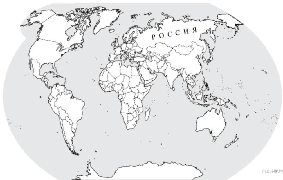
Карта составлена по состоянию на 01.01.2019

Религиозный состав населения какой страны отражает представленная на рисунке диаграмма? Запишите в ответе название страны.