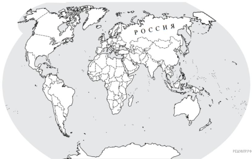
Карта составлена по состоянию на 01.01.2017

Структуру занятости населения какой страны отражает представленная на рисунке диаграмма? Запишите в ответе название страны.