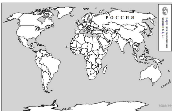
Карта составлена по состоянию на 01.01.2017

Определите, возрастной состав населения какой страны отражает каждая диаграмма. Запишите в ответе порядковые номера стран под соответствующими буквами.