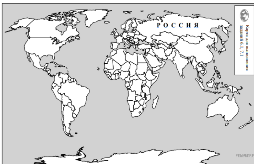
Карта составлена по состоянию на 01.01.2017

Определите, возрастной состав населения какой страны отражает каждая диаграмма. Запишите в ответе порядковые номера стран под соответствующими буквами.