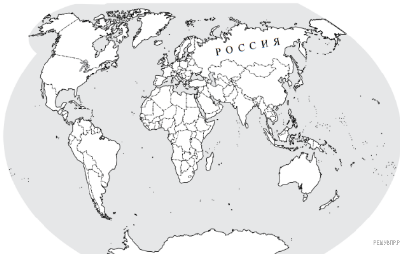
Карта составлена по состоянию на 01.01.2017

Определите, структуру занятости населения какой страны отражает каждая диаграмма. Запишите в ответе порядковые номера стран под соответствующими буквами.