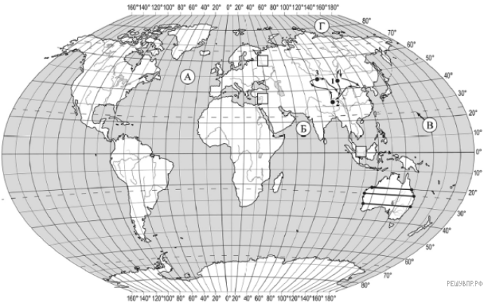
Карта составлена по состоянию на 01.01.2019

По какому из отрезков, проведённых на карте вдоль трёх параллелей, пересекающих материк Австралия, построен профиль рельефа, представленный на рисунке 1? Укажите в ответе значение параллели.