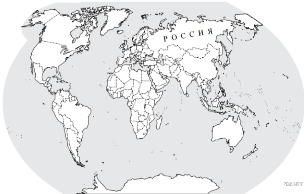
Карта составлена по состоянию на 01.01.2019

Определите, религиозный состав населения какой страны отражает каждая диаграмма. Запишите в ответе порядковые номера стран под соответствующими буквами.