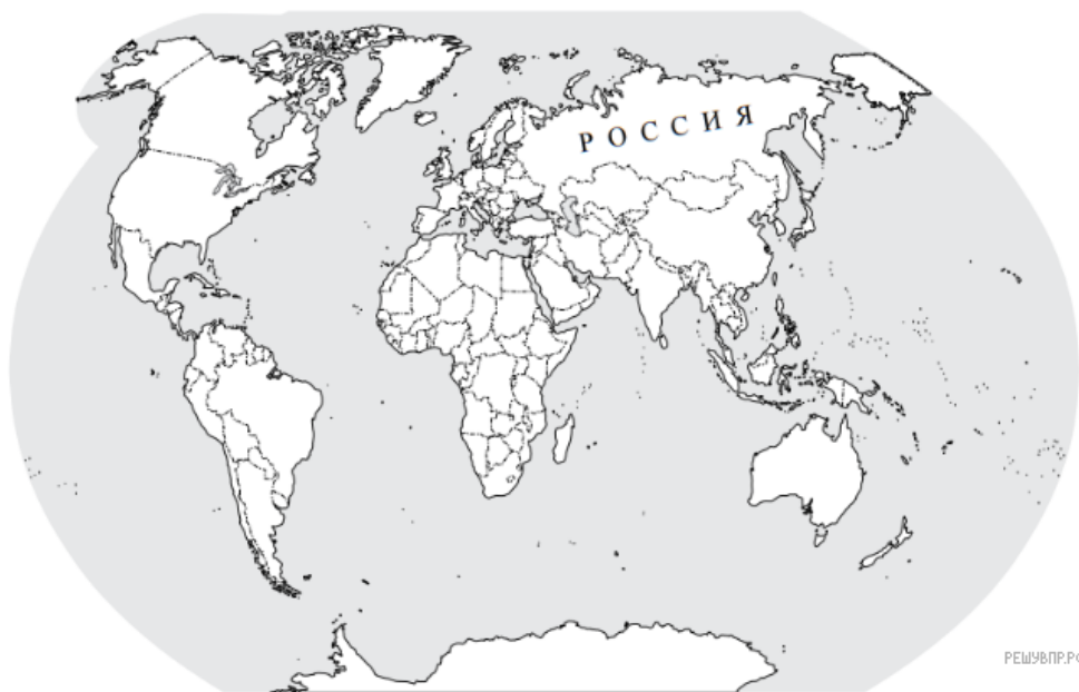
Карта составлена по состоянию на 01.01.2018

Определите, возрастной состав населения какой страны отражает каждая диаграмма. Запишите в ответе порядковые номера стран под соответствующими буквами.