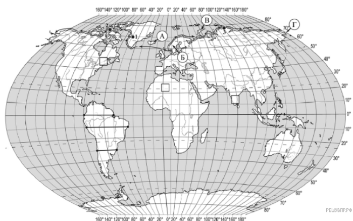
Карта составлена по состоянию на 01.01.2019

По выбранной Вами в задании 3.2 климатограмме определите климатические показатели для указанной природной зоны и заполните таблицу.