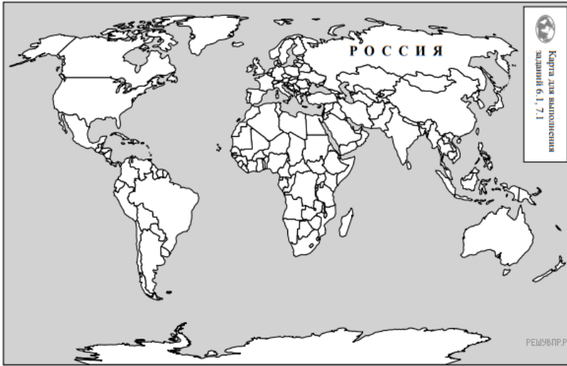
Карта составлена по состоянию на 01.01.2017

Определите, возрастной состав населения какой страны отражает каждая диаграмма. Запишите в ответе порядковые номера стран под соответствующими буквами.