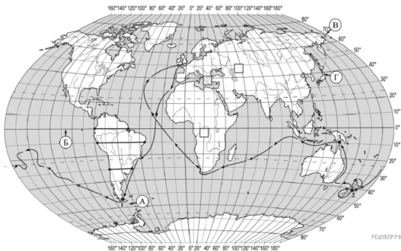
Карта составлена по состоянию на 01.01.2019

По какому из отрезков, проведённых на карте вдоль трёх параллелей, пересекающих материк Южная Америка, построен профиль рельефа, представленный на рисунке? Укажите в ответе значение параллели.