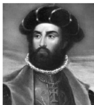
Васко да Гама