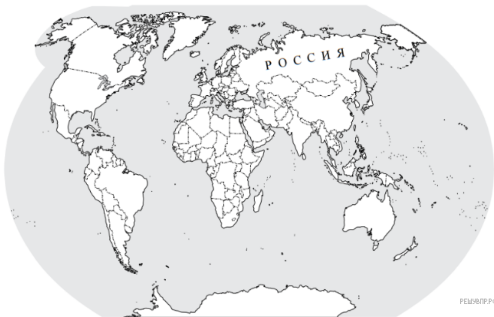
Карта составлена по состоянию на 01.01.2019

Определите, религиозный состав населения какой страны отражает каждая диаграмма. Запишите в ответе порядковые номера стран под соответствующими буквами.