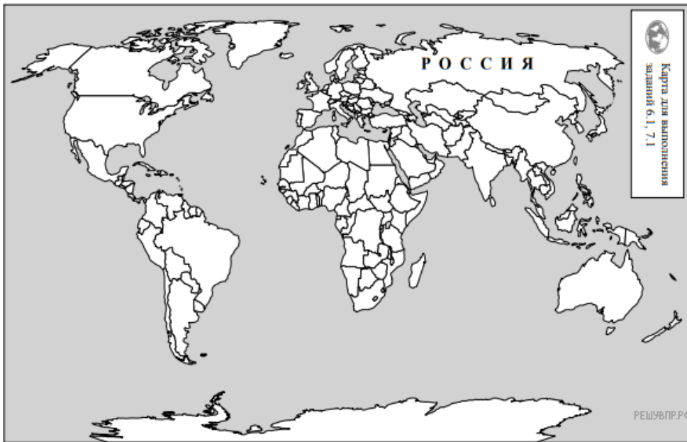
Карта составлена по состоянию на 01.01.2017

Определите, возрастной состав населения какой страны отражает каждая диаграмма. Запишите в ответе порядковые номера стран под соответствующими буквами.