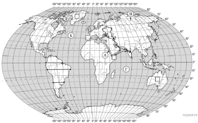
Карта составлена по состоянию на 01.01.2019

По какому из отрезков, проведённых на карте вдоль трёх параллелей, пересекающих материк Южная Америка, построен профиль рельефа, представленный на рисунке? Укажите в ответе значение параллели.