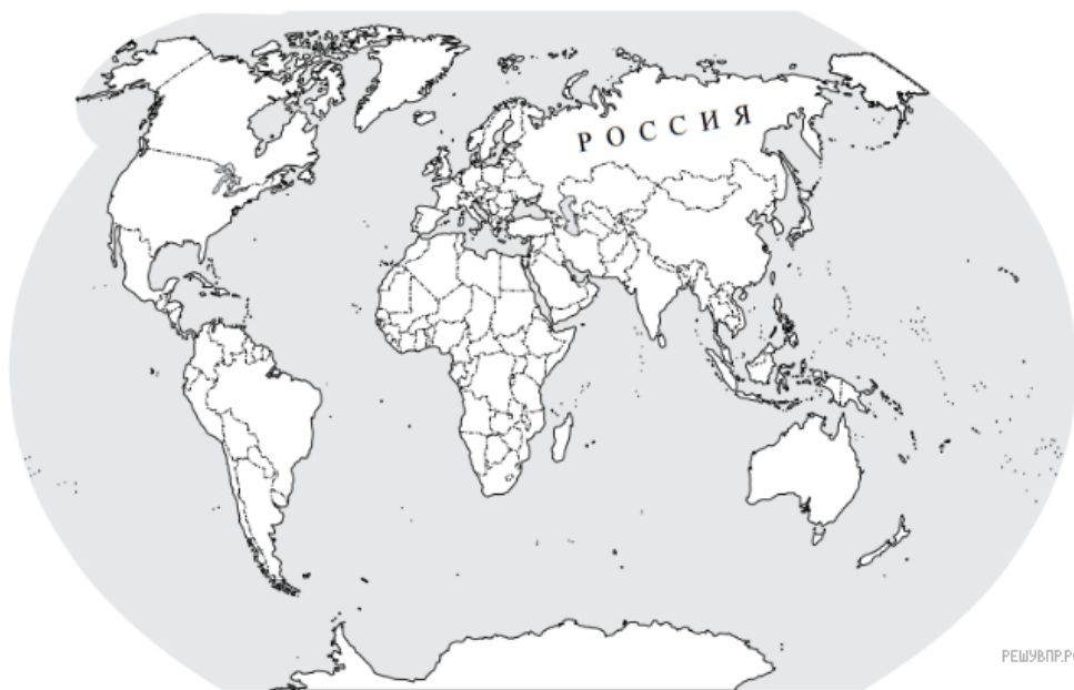
Карта составлена по состоянию на 01.01.2017

Определите, возрастной состав населения какой страны отражает каждая диаграмма. Запишите в ответе порядковые номера стран под соответствующими буквами.